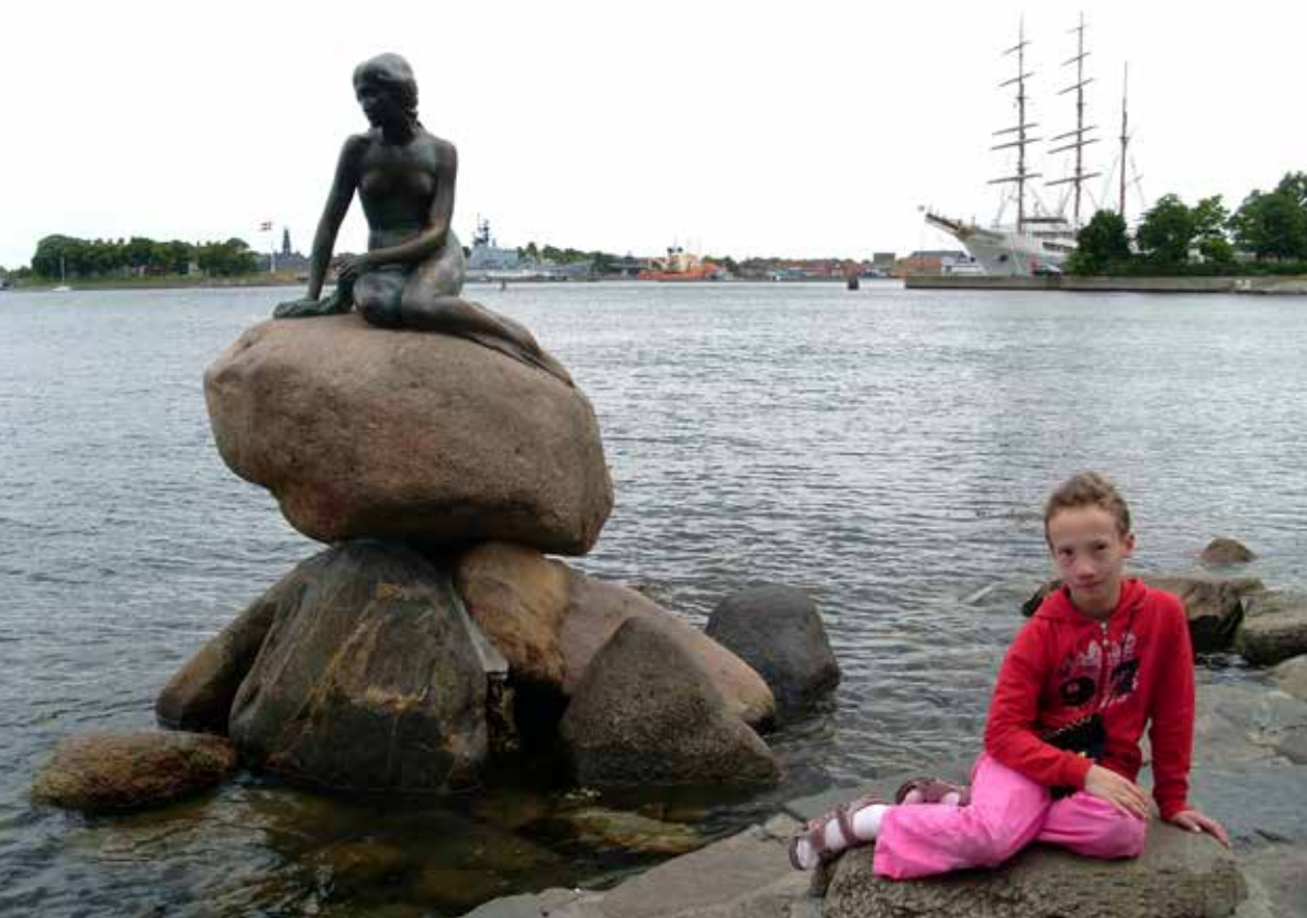
Line under en tur til København i 2008