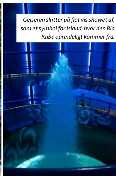
Gejseren slutter på flot vis showet af, som et symbol for Island, hvor den Blå Kube oprindeligt kommer fra.